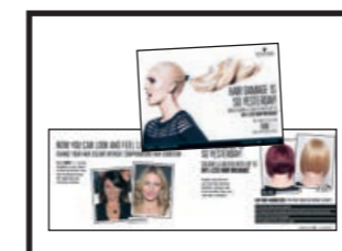
LETÁČKY PRO ZÁKAZNICE